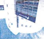
静岡東展示場から移動したSBS リーク・エコースタ

SBS リーク・エコースタ 静岡市駿河区森田町8-17 054 (268) 1400 本社 / 静岡市清水区八坂北1-3-8 0120 (770) 791 http://www.ecostudio-inc.com/