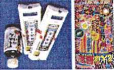
フレキシブルソーラーパネルの設置例

「ソーラーカーポート」は、従来の駐車スペースに比べて、屋根の傾斜角を自由に調整できるため、太陽光の照射角度を最適化し、発電効率を最大化できます。また、パネルの向きや傾斜角を自由に調整できるため、季節や天候に応じて最適な発電環境を創出できます。さらに、パネルの傾斜角を自由に調整できるため、パネルの向きや傾斜角を自由に調整できるため、季節や天候に応じて最適な発電環境を創出できます。